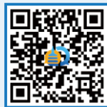
北京通州教育咨询