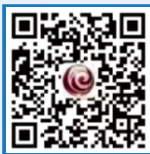
北京市通州区教委

您可以关注“北京市通州区教委”公众号，或登录“北京通州教育咨询”平台（ http://zxzx.bjtzeduyun.com/ ），查看入学相关政策。